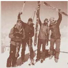
6月に訪れた、標高5642mのエルブルース山頂にて。下山はスキーだ